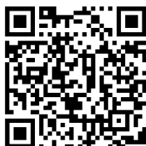
Страница изделия в интернете

http://les.ru/catalog/pulty-upravleniya-s-klyuchami/kr-21c-k/